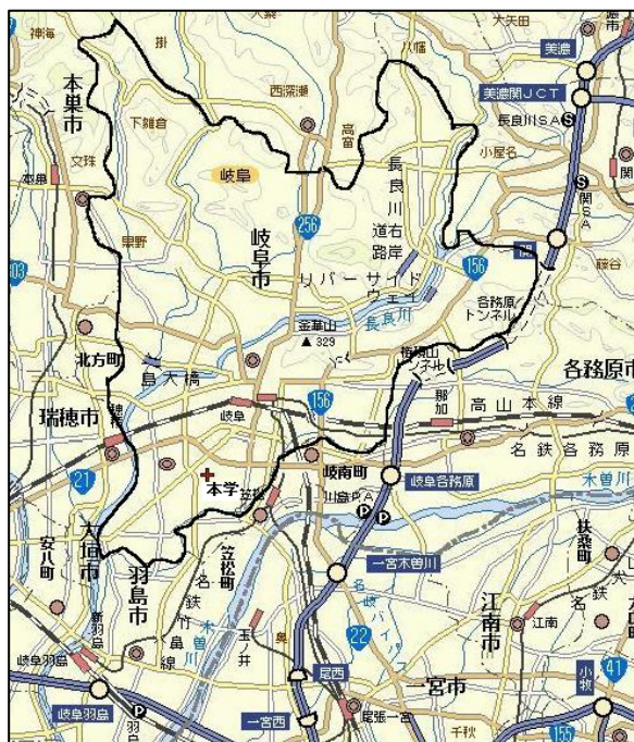
岐阜市全体図 図表 3

(3) 法人理事長、学長の氏名、連絡先及びその略歴、ALO の氏名、連絡先及びその略歴。なお、連絡先としては、TEL、FAX、E-Mail 等を記載して下さい。