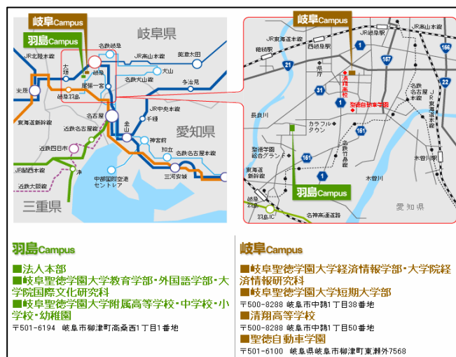
本学案内図及び学校法人聖徳学園全体案内図 図表 2

本学の所在地である岐阜市は、人口 420,891 人（平成 21 年 3 月 1 日現在）、平成 8 年 4 月 1 日より中核市の指定を受けている。戦後は、繊維産業を中心に発展し、東京、大阪と並ぶ全国有数のアパレル産地となった。古くから美濃和紙や良質の竹材に恵まれたことから提灯、和傘、うちわ、油紙、のぼり鯉などの伝統工芸も脈々と受け継がれている。